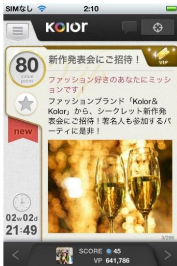
【ミッション (VIP クーポン)】