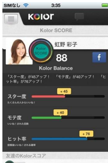
【マイページ (PMV スコア)】