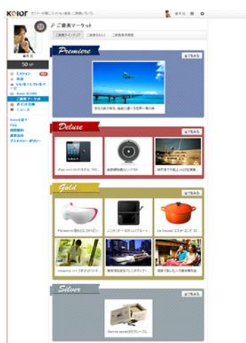
【ご褒美マーケット】