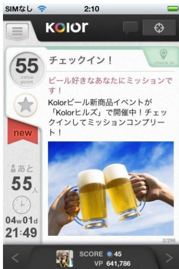
【ミッション (チェックイン)】